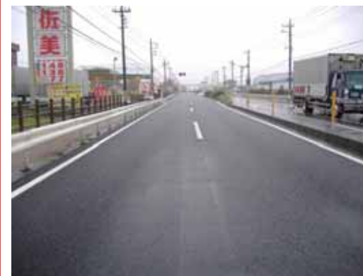
事業後の状況(雨天時)