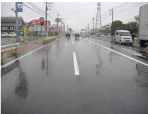
事業前の状況(雨天時)