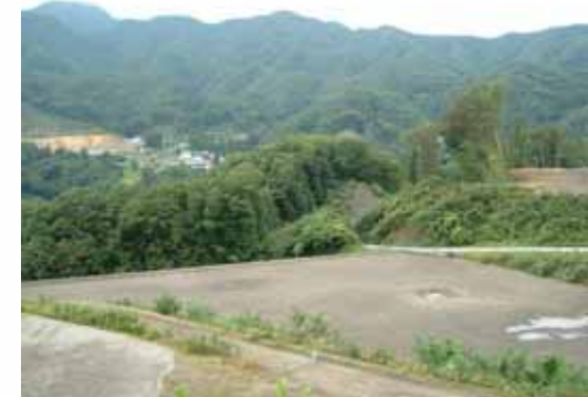
橋梁計画地(川原湯側より望む)