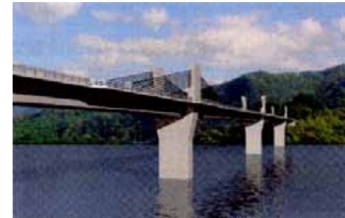
県道川原畑大戸線: 湖面1号橋 (完成イメージ)

◆ダム湖ができ離れてしまう移転代替地が橋により結ばれ水源地域住民の利便性が確保されます。