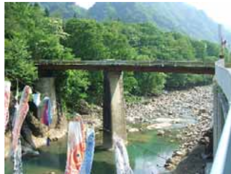
町道川原湯久森線: 栄橋